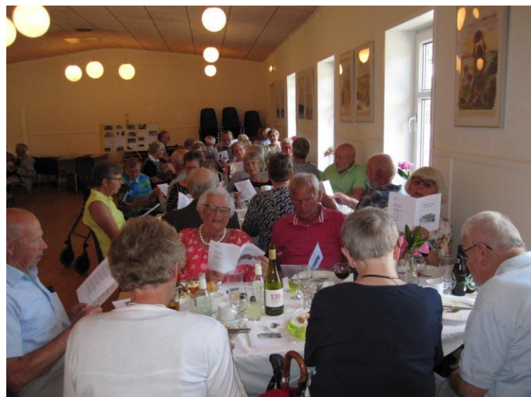
Fotos fra seneste sammenkomst i 2016