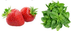
Linalool (venstre) Linalool (højre)

Mange molekyler i vores mad giver en vidt forskellig smag alt efter, hvilken symmetri de har selvom de er sammensat af de samme atomer. Fx findes smagsstoffet linalool i to spejlbilledformer: venstre spejlbilledform findes i jordbær og højre spejlbilledform findes i lavendel og basilikum.