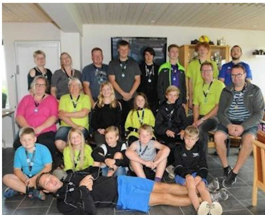
Foto: Arrangører, medhjælpere, dommere ved DGI stævnet 2016