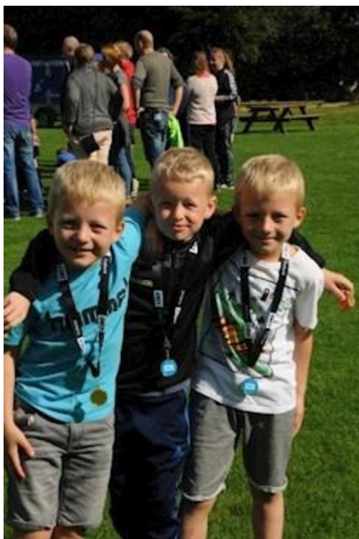
Foto: Glade deltagere i DGI Cup 2016