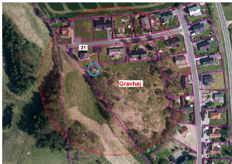
Den røde prik er gravhøjen, mens den blå ring viser skuret. Den store røde ring er 100 m beskyttelseszonen omkring gravhøjen.

at udvalget beslutter at meddele afslag på ansøgning om dispensation til at beholde brændeskuret med hjemmel i naturbeskyttelseslovens § 18 og at der samtidig varsles påbud om at fjerne skuret og flisegangen i henhold til naturbeskyttelseslovens § 73, stk. 5.