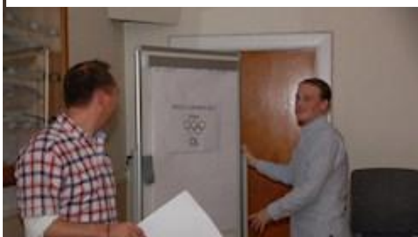
Afsløring af byfesttema 2017

Byfesten i Låstrup har siden år 2000 haft et tema, som udsmykning, udklædning og aktiviteter gennem årene har taget udgangspunkt i. Det har været et varieret valg af forskellige temaer, hvor byens borgere har været vikinger, eventyrdeltagere, fodboldspillere, soldater og meget mere.