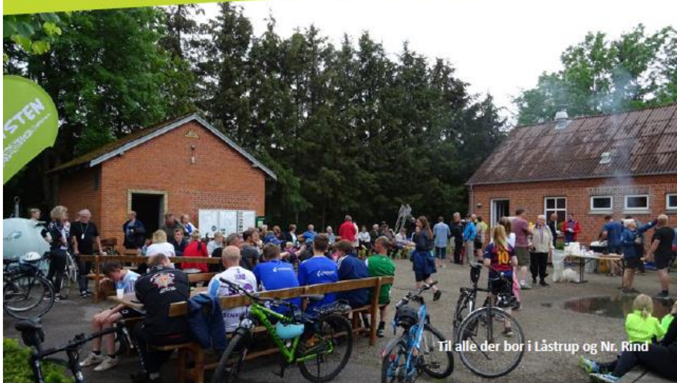
Til alle der bor i Låstrup og Nr. Rind

www.borupif.dk/forside/2020-nyheder/marts/lokaldysten-i-nrrindlaastrup-2020/