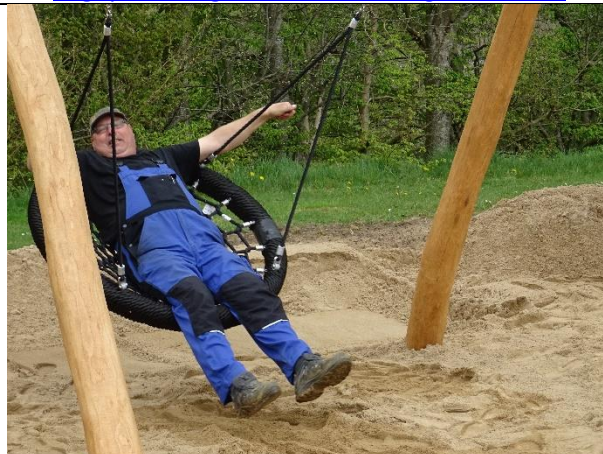
Legepladsen godkendt af Viborg Kommune