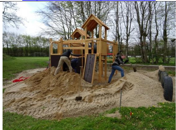
9. og 10. arbejdsdag legeplads Borup IF