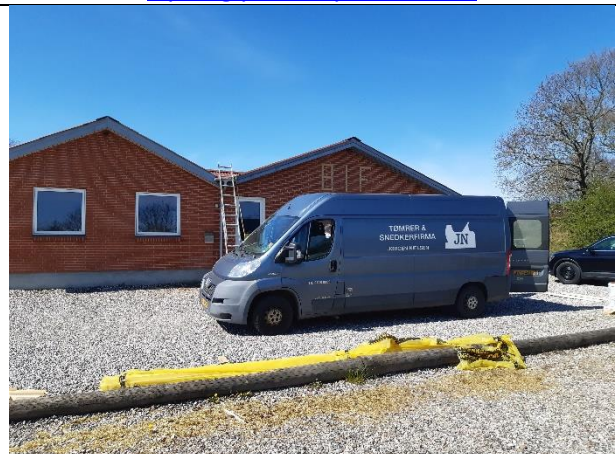
Nyt tag på Borup IF klubhus