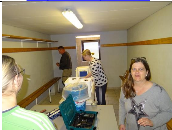
Maling af omklædningsrum Borup IF