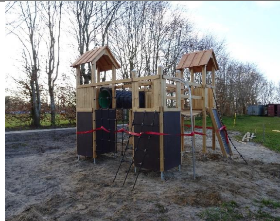
Ny legeplads på Borup Stadion