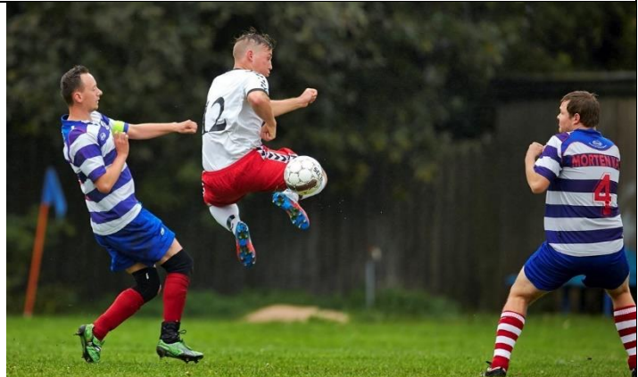
Corona nedlukning til 10. maj