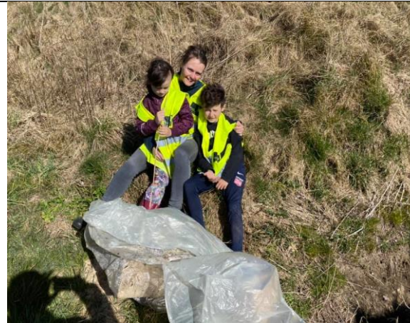
Alternativ affaldsindsamling i Låstrup