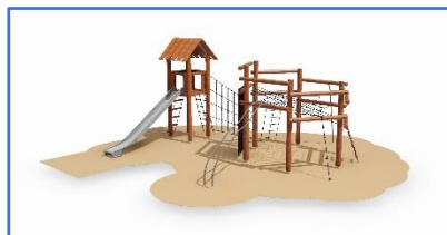
Legeplads for de større