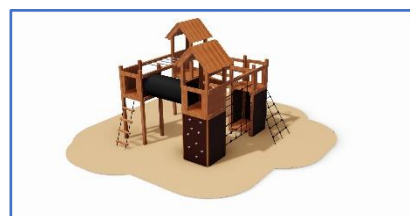
Legeplads for de mindste