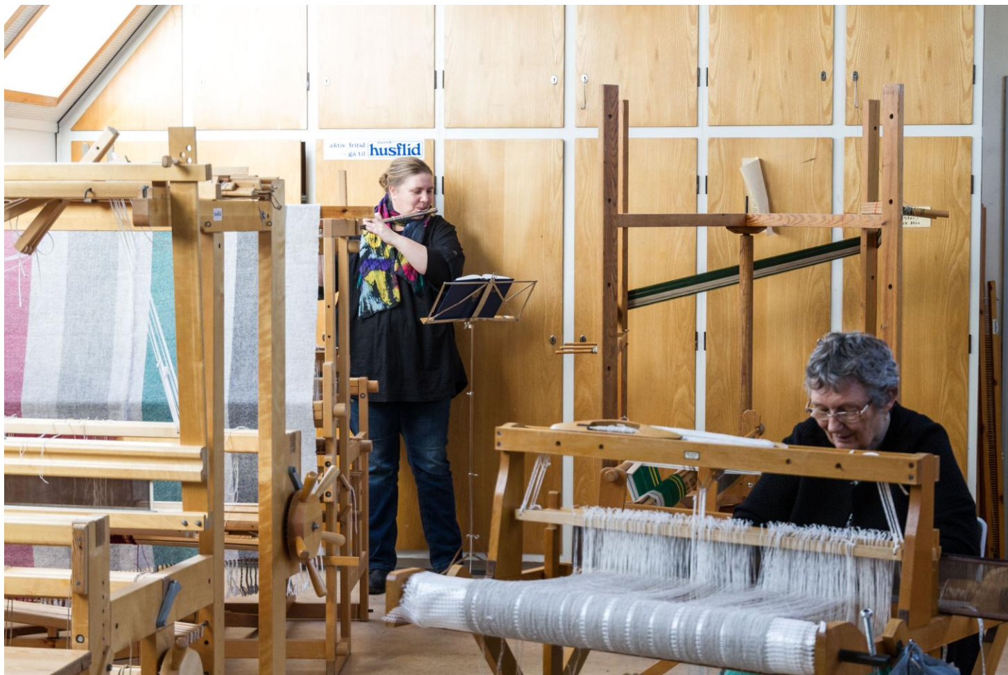
Foto: Vævestuen ved forårsudstilling 2018